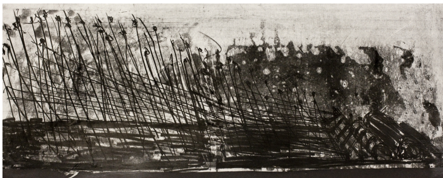
Monotype, dessin préparatoire de l'installation

107 tiges d'acier surmontées de restes de feuilles, 800 m de fil nylon noir, sable noir, haut-parleurs, mécanisme automatisé, ordinateurs, bidon en métal, lumières, vidéoprojecteur, cage à oiseaux, bras motorisé, bol tibétain, ampoule led.